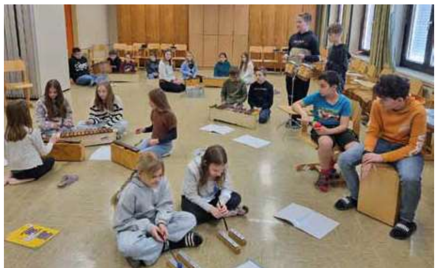
Die neuen Orff-Instrumente im Einsatz