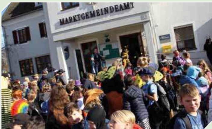
Wie alljährlich – Faschingszug der Volksschule mit Musikbegleitung zum Marktgemeindeamt & Empfang durch Bürgermeister Franz Platzer