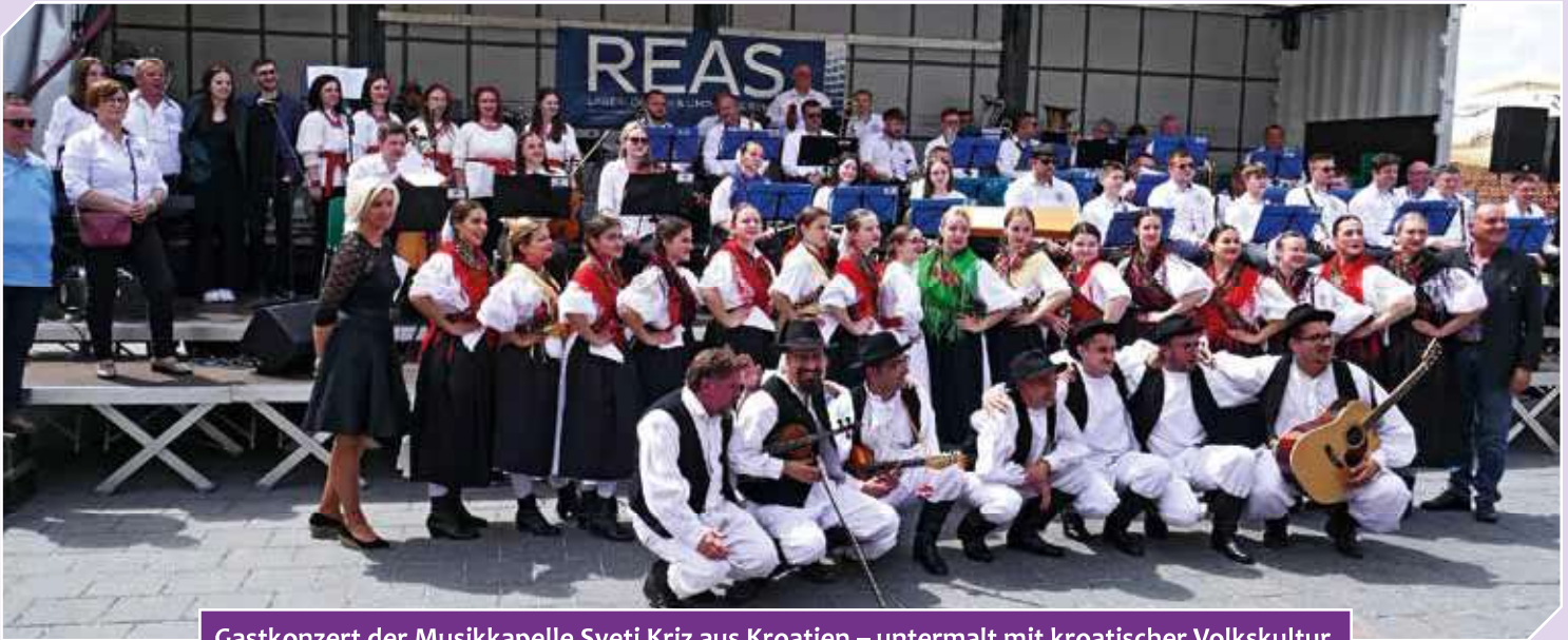
Gastkonzert der Musikkapelle Sveti Kriz aus Kroatien – untermalt mit kroatischer Volkskultur