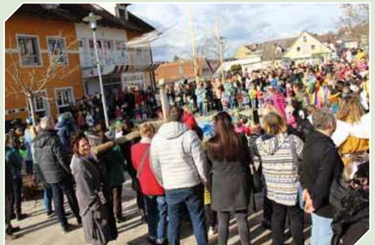
Auftritt der Kleinen vor dem Pfarrkindergarten