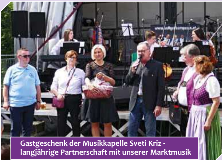
Gastgeschenk der Musikkapelle Sveti Kriz - langjährige Partnerschaft mit unserer Marktmusik