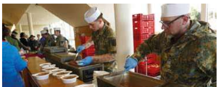
Verdiente Stärkung für die Teilnehmer und Gäste