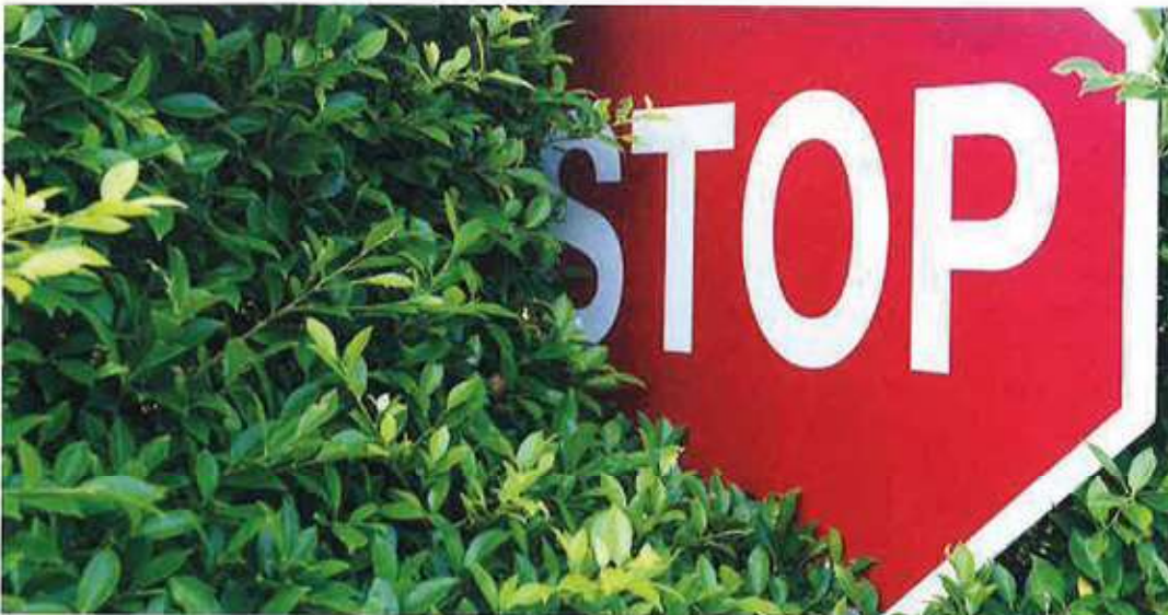
Beeinträchtigungen der Sicht durch Äste oder Sträucher gefährden die Verkehrssicherheit.

Es ist wichtig, dass alle Bürger ihren Beitrag zur Verkehrssicherheit leisten, indem sie ihrer Beseitigungspflicht von Ästen entlang der Straßen nachkommen. Dies trägt zu einer gefahrlosen Benützung der Gemeindestraßen, Wege und Gehsteige bei und ist in unser aller Interesse.