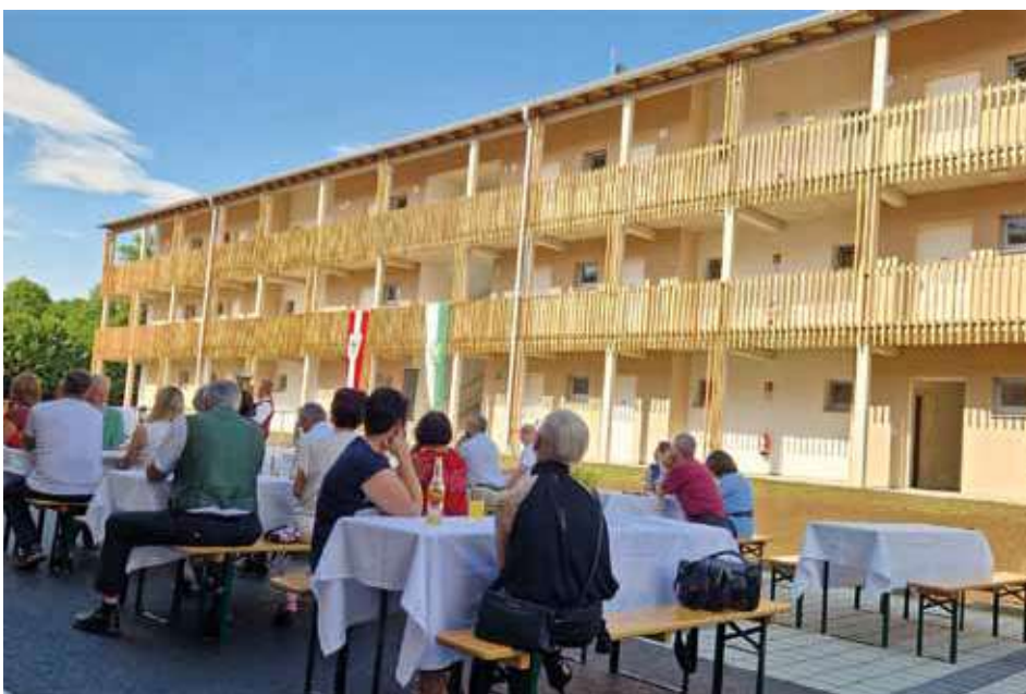
Betreubares Wohnen, Leibnitzer Straße 9 B

Interessenten können sich jederzeit beim Marktgemeindeamt für die Weiterleitung an die Gebäudeverwaltung melden.