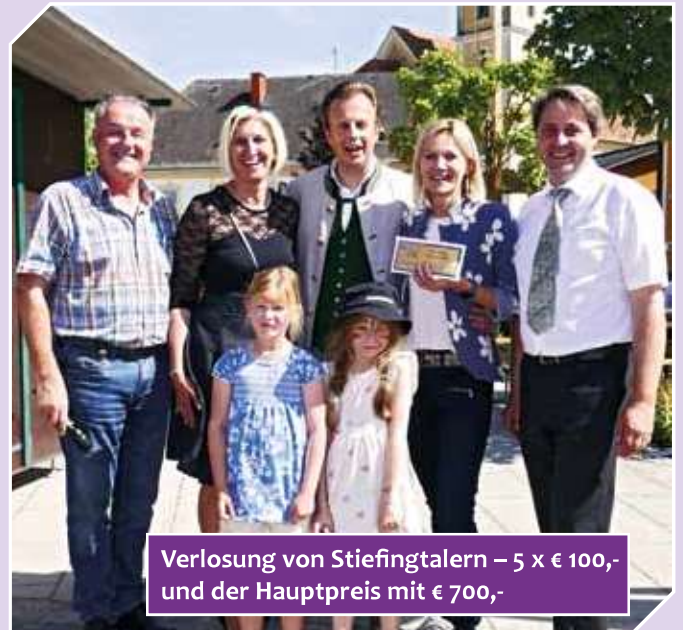
Verlosung von Stiefingtalern – 5 x € 100,- und der Hauptpreis mit € 700,-