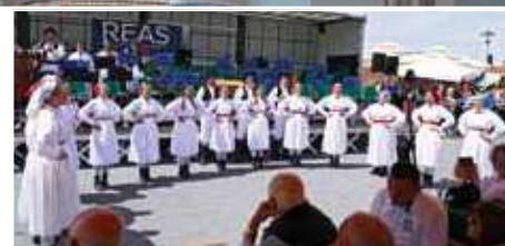
Volksfest am Markt & Konzert Sveti Kriz Seite 10 u. 11