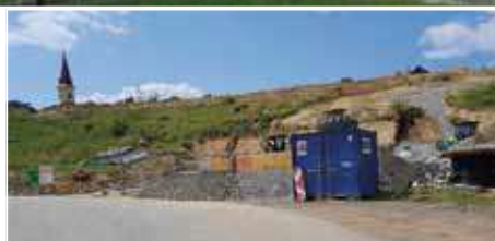
Baustart Nahwärme St. Ulrich/W.