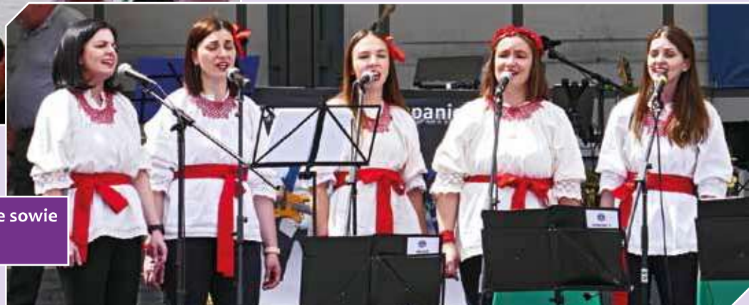
Tambura-Orchester und Gesangsgruppe sowie Folkloregruppe „KUD Horvatska“