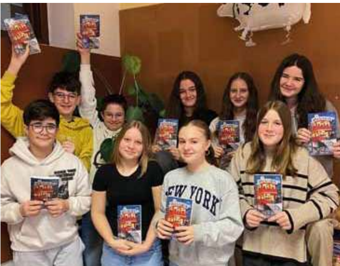
Englisch-Bücher für die 3. Klassen