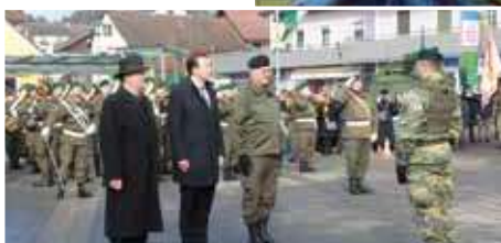
Angelobung am Marktplatz Seite 6 u. 7