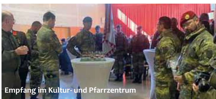
Empfang im Kultur- und Pfarrzentrum