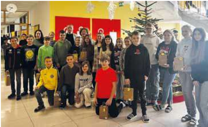
Gewinner „Sauberste Klasse“ (Weihnachten)