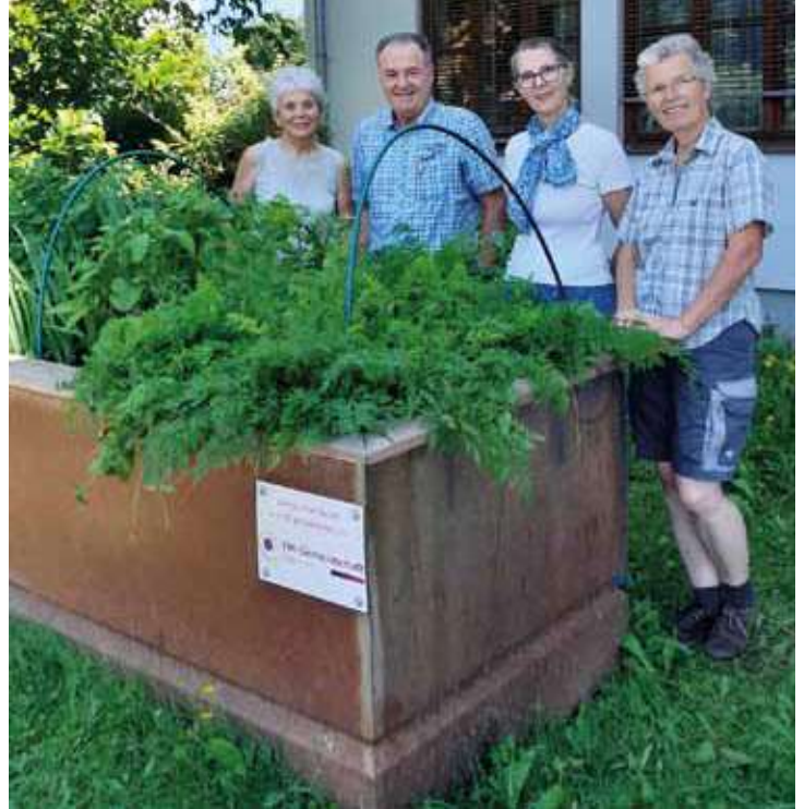
Besuch und Übergabe der EM-Vertretung Österreich vor dem Marktgemeindeamt

Möchten Sie auch unsere Arbeit und damit den Einsatz für eine gesündere Umwelt unterstützen? Über unsere homepage www.em-gemeinschaft.at erfahren Sie mehr dazu.