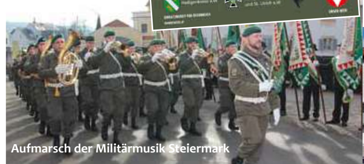
Aufmarsch der Militärmusik Steiermark