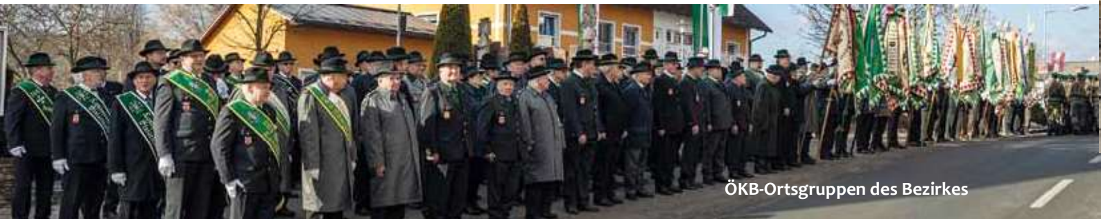
ÖKB-Ortsgruppen des Bezirkes