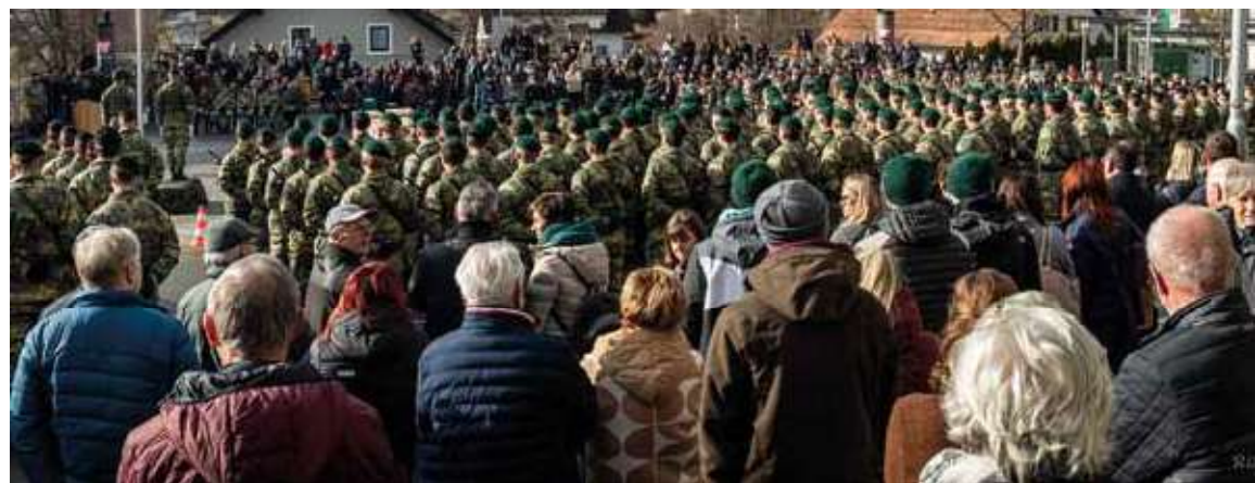
Ein einmaliges Erlebnis für alle Teilnehmer, Gäste und Besucher an der Angelobungsfeier der Präsenzdiener aus der Kaserne Straß!