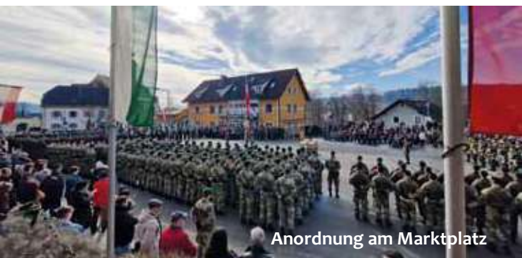
Anordnung am Marktplatz