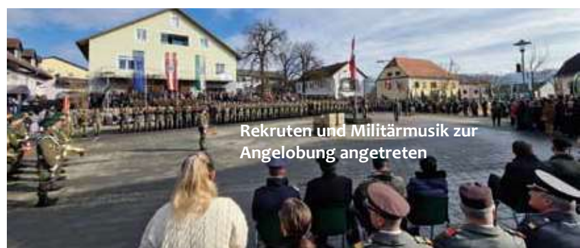
Rekruten und Militärmusik zur Angelobung angetreten