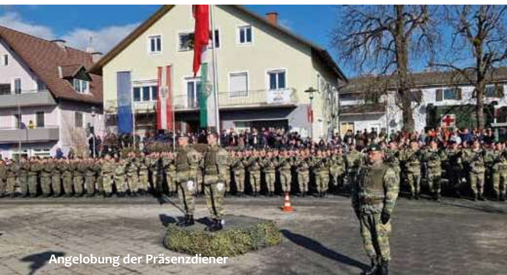
Angelobung der Präsenzdiener