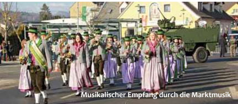
Musikalischer Empfang durch die Marktmusik