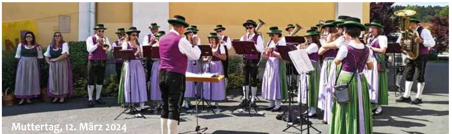
Muttertag, 12. März 2024