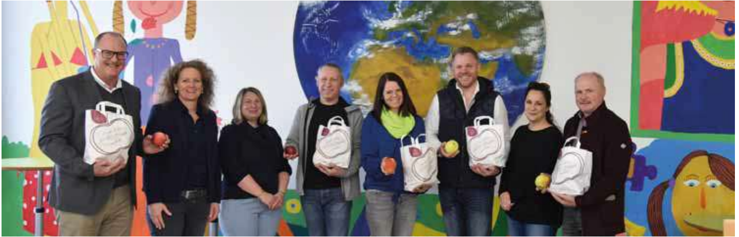
Abschluss Apfelaktion vor den Osterferien

Mit viel Freude und Motivation haben wir im Schuljahr 2023/24 wieder einige Projekte umgesetzt und unterstützt: u.a. die jährlich stattfindende Apfelaktion von Herbst bis Ostern mit Sponsoring durch die 4 Schulsprengelgemeinden, Adventkränze für alle Klassen, ein Buffet mit kulinarischen Köstlichkeiten und einem Schätzspiel am Elternsprechtag (Preis: Reiter's Bauernspezialitäten), das Projekt „Sauberste Klasse“ inklusive 2 Prämierungen (vor Weihnachten und vor Ostern) mit finanzieller Unterstützung der Marktgemeinde Heiligenkreuz am Waasen in Form von Stiefingtaler-Gutscheinen für die jeweiligen Gewinnerklassen, den Ankauf englisch- und deutschsprachiger Bücher für die Förderung der Lesekompetenz und v.a. für den Wortschatzerwerb in Englisch, köstliche Faschingskrapfen der Fa. Teschl für alle Schülerinnen und Schüler der Mittelschule, einen finanziellen Beitrag für die