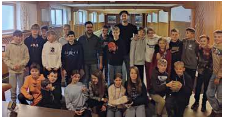
Kegeln der 2c-Klasse im GH Hirschenwirt

Auch bei Aktionen anderer Institutionen stellten wir uns gerne in den Dienst der guten und wie in diesem Fall „sauberen“ Sache – so konnten wir dieses Jahr bereits zum dritten Mal bei der Müllsammelaktion der Gemeinde Heiligenkreuz tatkräftig mithelfen.