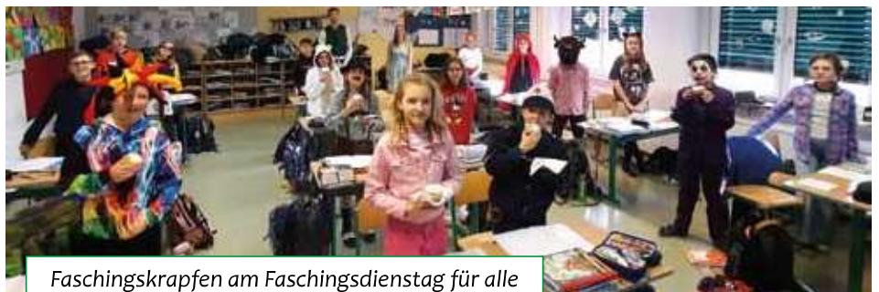
Faschingskrapfen am Faschingsdienstag für alle Schülerinnen und Schüler