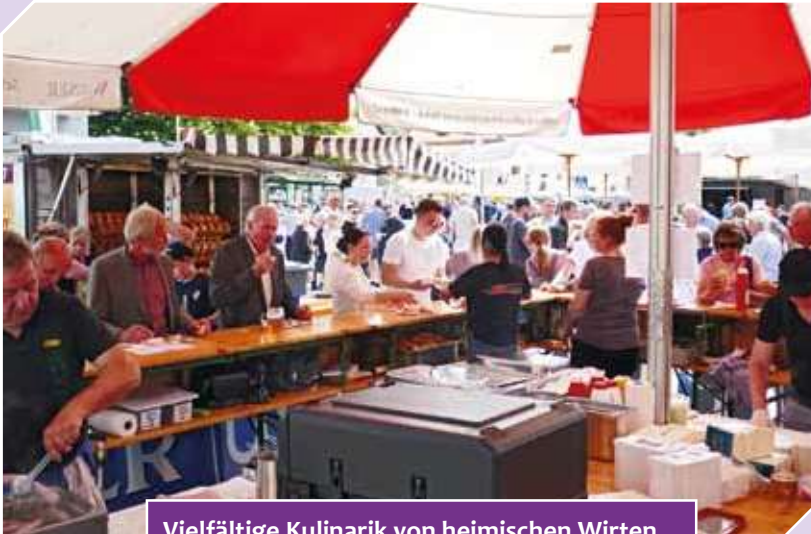
Vielfältige Kulinarik von heimischen Wirten