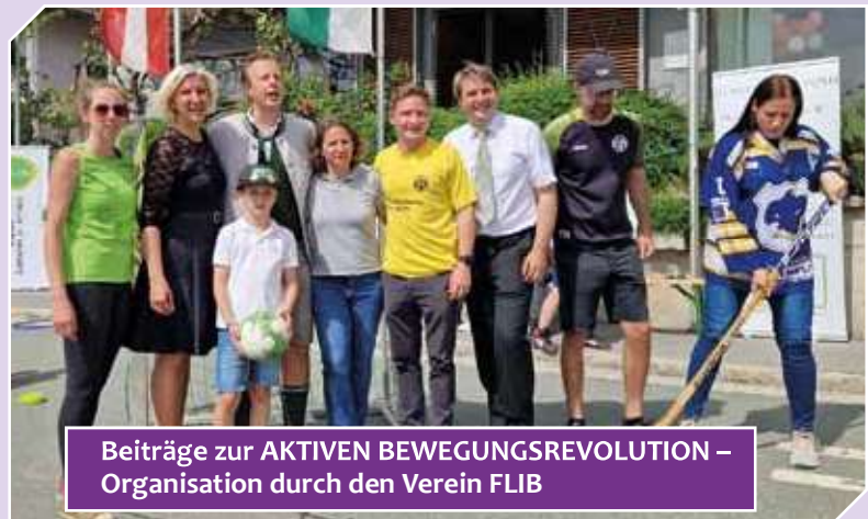
Beiträge zur AKTIVEN BEWEGUNGSREVOLUTION – Organisation durch den Verein FLIB