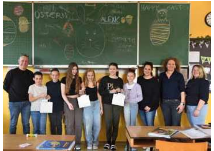
Gewinner „Sauberste Klasse“ (Ostern)