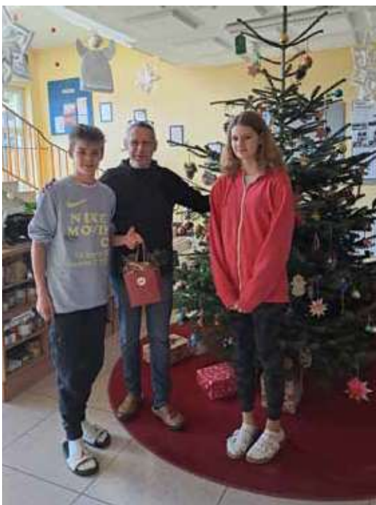
Buffet und Schätzspiel am Elternsprechtag vor Weihnachten, Gewinner Schätzspiel

Wir bedanken uns für alle Unterstützungen und wünschen einen schönen und erholsamen Sommer!