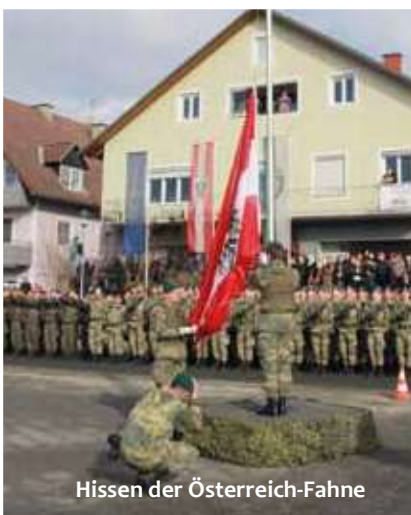
Hissen der Österreich-Fahne