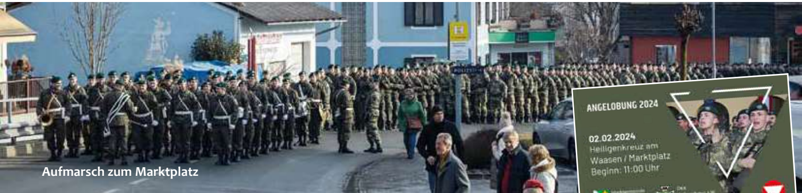
Aufmarsch zum Marktplatz