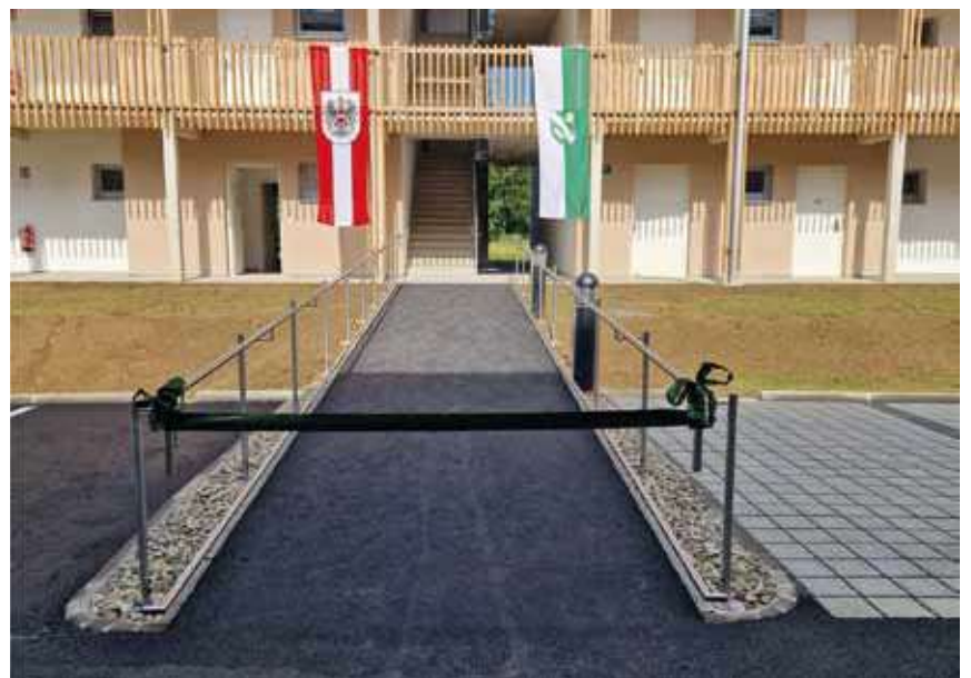
Betreubares Wohnen - Barrierfreier Zugang zu Haus&Lift