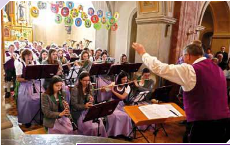
Kirchliches Fest des Patroziniums „Zu den Heiligen Kreuzen“ - Markttag mit zahlreichen Marktferanten